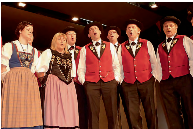
Jodlerklub Maiglöggli, Zentralschw. Jodlerfest Klasse 1.