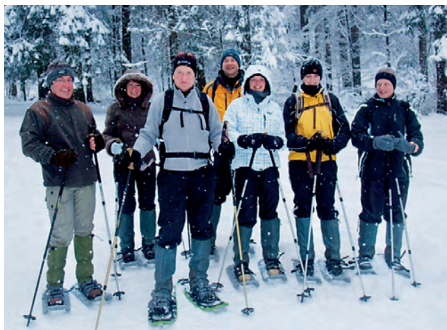
Stüürämter im Schnee.