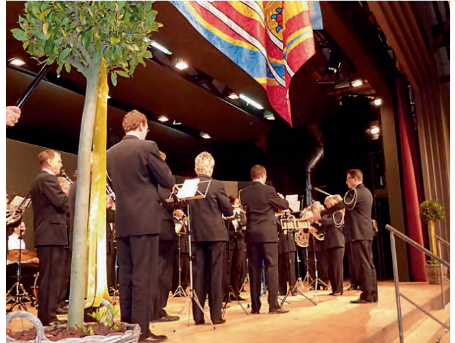
Feldmusik Willisau, Sieg in Valencia.