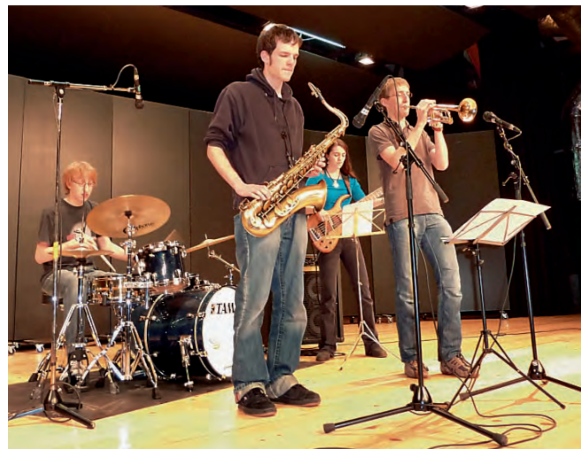
Jazzband «Das Episkop».