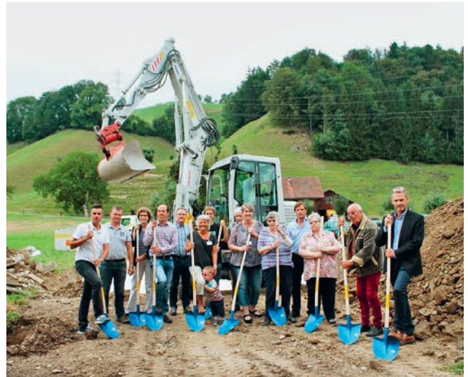
Vertreter aller beteiligten Parteien beim Spatenstich in der Breiten.

Bis der Rohbau steht, wird der Heimbetrieb wie gehabt weiterlaufen. Ab Mitte/Ende Januar 2017 werden der rund zehnmonatige Innenausbau des neuen Gebäudetrakts und die Sanierung des Altbaus beginnen. Während dieser Zeit werden die 28 Bewohner an einem anderen Ort untergebracht. Dieser temporäre Unterbringungsort wird öffentlich kommuniziert, sobald die entsprechenden Verträge unterzeichnet sind.