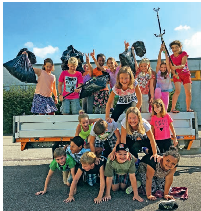
Kinder der Klasse 5a

Nächstes Jahr findet der Clean-Up-Day am Freitag, 8. und Samstag, 9. September 2017 statt.