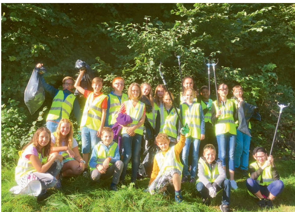
Kinder der Klasse 6b