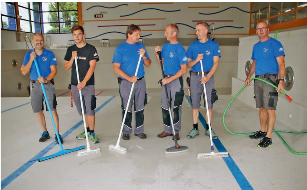
In der kurzen Sommerpause wurde das Bassin abgelassen, von den Sportzentrum-Mitarbeitern gereinigt und wo nötig repariert. Jetzt stehen die 750'000 Liter Wasser (fast 1'900 Badewannen!) den vielen verschiedenen Gästen uneingeschränkt zur Verfügung.