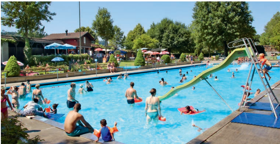
Das Freibad Willisau, in welchem sich im Sommer Gross und Klein abkühlen und vergnügen, geht in die Winterpause. Die altehrwürdige Badi wird im nächsten Sommer 95-jährig!

Im kommenden Sommer jährt sich die Ersteröffnung der Willisauer Badi zum 95. Mal. Wer weiss, ob das nicht ein kleines (Badi-)Fest wert ist!