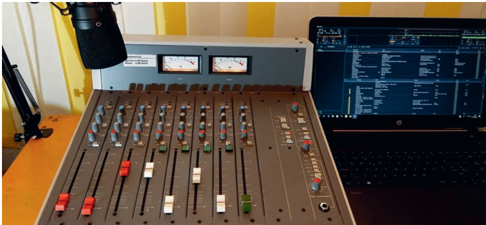
Die Schüler der Sekundarschule Willisau gehen live auf Sendung.