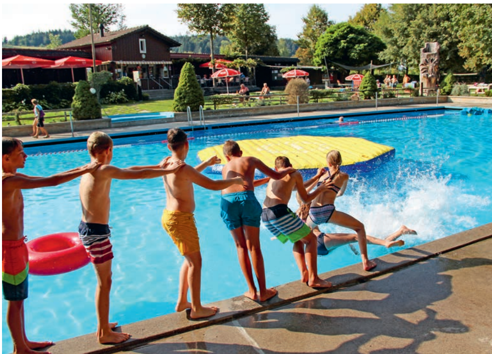
Über 22000 Gäste haben im Sommer die Willisauer Badi besucht (auf unserem Bild eine Ettiswiler Schulklasse).

Hinweis an die Kabinenmieter: Wer seine Kabine noch nicht geräumt hat, sollte das noch bis Ende Oktober 2018 erledigen. Bitte telefonische Anmeldung unter 041 972 60 10.