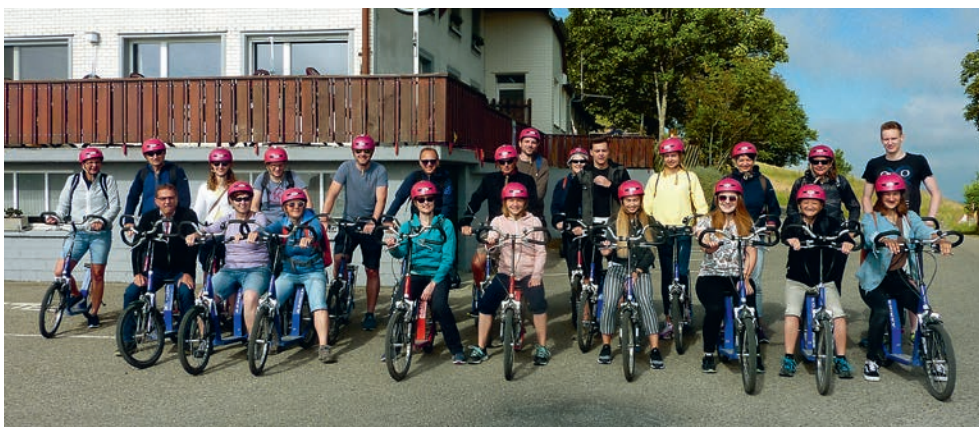
Das Personal des DLZ auf der Ahornalp.

Am Nachmittag zeigten die Sportler der Hornussergesellschaft Obersteckholz dem DLZ-Team die Kunst des Hornussens. Beim Versuch diese Sportart auszuüben, wurde viel gelacht und es wurden sogar Talente entdeckt. Zum Schluss genossen die Mitarbeitenden einen Apéro, bei dem sie sich über ihre Hornussererfahrung austauschen konnten. Anschliessend führte die Fahrt wieder zurück nach Willisau.