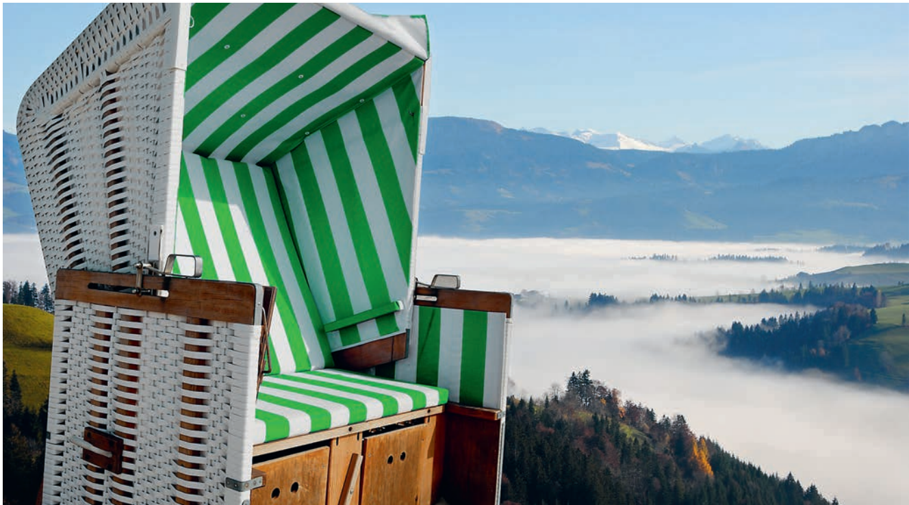
Gemütlich im Strandkorb sitzend kann man eine wunderbare Aussicht geniessen.

Hauptgasse 10, 6130 Willisau, 041 970 26 66, info@willisau-tourismus.ch, www.willisau-tourismus.ch Öffnungszeiten: Montag–Freitag, 08.30–12.00 Uhr und 13.30–17.00 Uhr