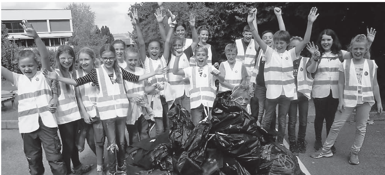
Eindrücke vom Clean-Up-Day 2018.