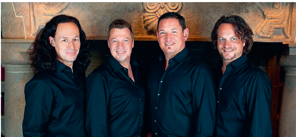
Die vier Schweizer Tenöre von «I QUATTRO» sind in Willisau zu Gast.

-besuchern. Mit zahlreichen erfolgreichen Tourneen, TV- und Radioauftritten sind sie aus der Schweizer Musik- und Showszene nicht mehr wegzudenken. Jede ihrer Stimmen ist einzigartig. Trotzdem verstehen sie es meisterhaft auch in mehrstimmigen Gesängen die Leute zu berühren, sie zu begeistern und eine beeindruckende Einheit zu bilden. Dieses Jahr sind sie anlässlich ihrer grossen Weihnachtstournee in 13 Kirchen in der ganzen Deutschschweiz zu sehen und zu hören. Wir freuen uns, dass auch Willisau darunter ist! Tickets sind erhältlich unter www.ticketcorner.ch .