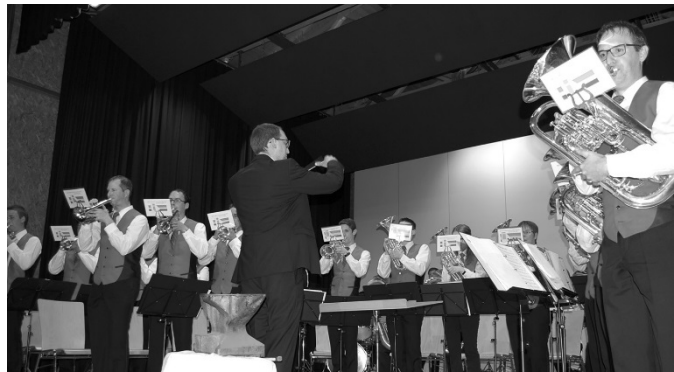
Stehend verabschiedete sich die Band vom begeisterten Publikum.