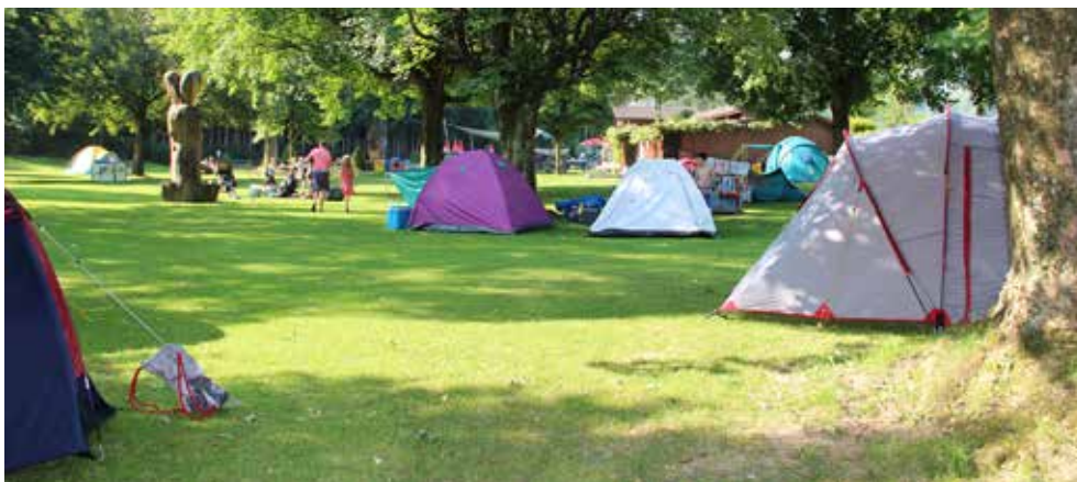
Der Start in die Freibad-Saison 2019 ist auf Anfang Mai geplant.

Weitere Infos finden Sie unter www.sportwillisau.ch