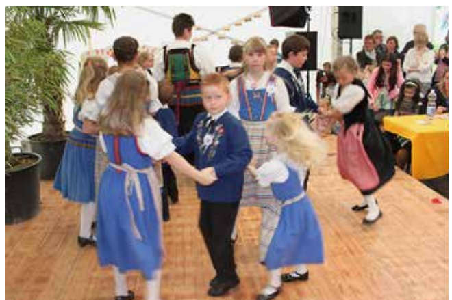
Eindrücke vom letzten Sommerfest.