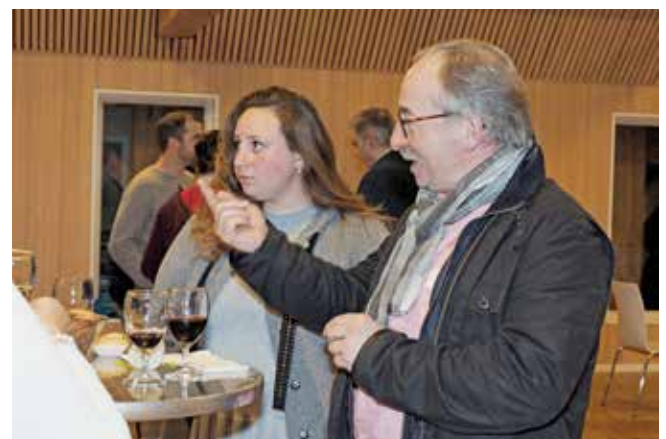
Einblicke in die Neuzuzügerbegrüssung.