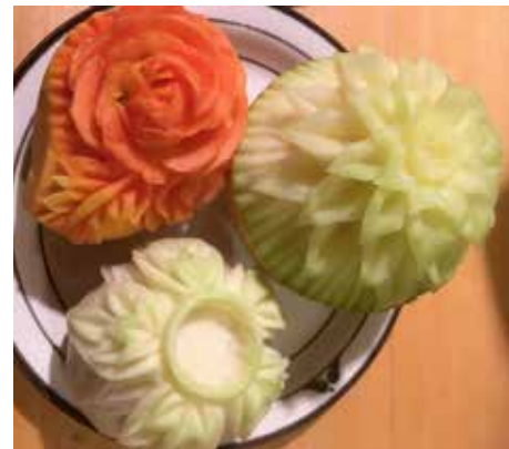
Geng Portmann zeigt die Kunst des Gemüseschnitzens.