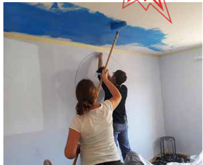
Die Jugendlichen während der Malerarbeiten.