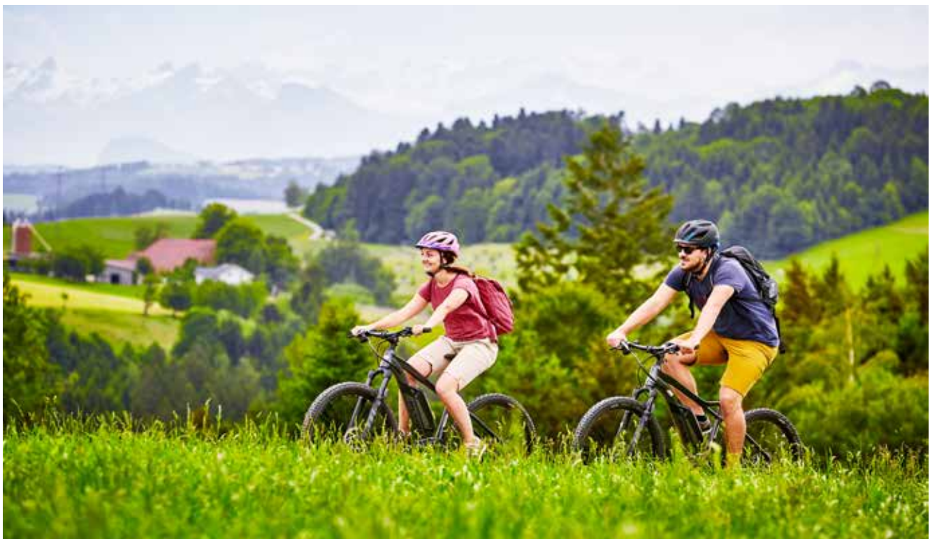
Auf der Herzschlaufe Napf können Sie die Natur geniessen.

Willisau Tourismus, Hauptgasse 10, 6130 Willisau Telefon 041 970 26 66, Fax 041 970 06 66 www.willisau-tourismus.ch