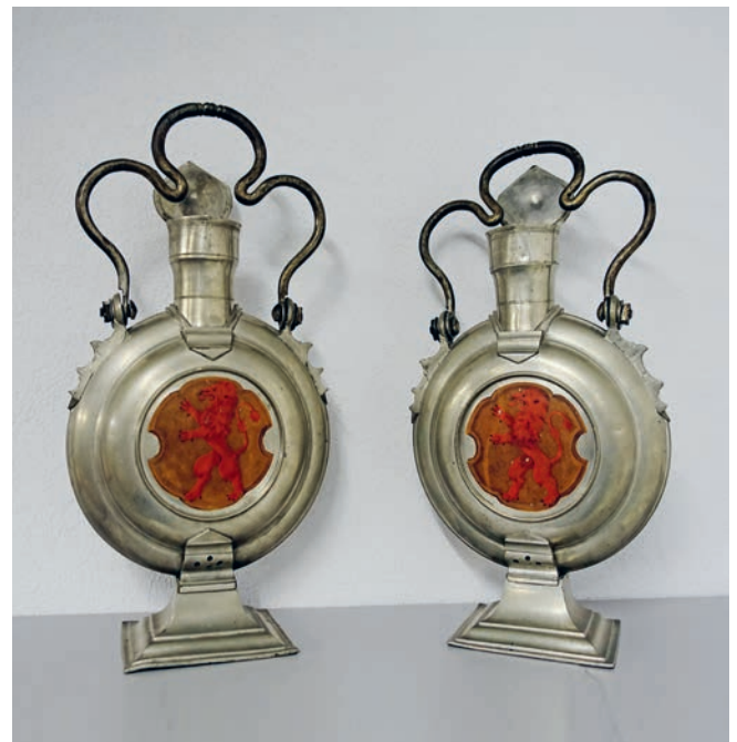
Die zwei Willisauer Ratskannen.