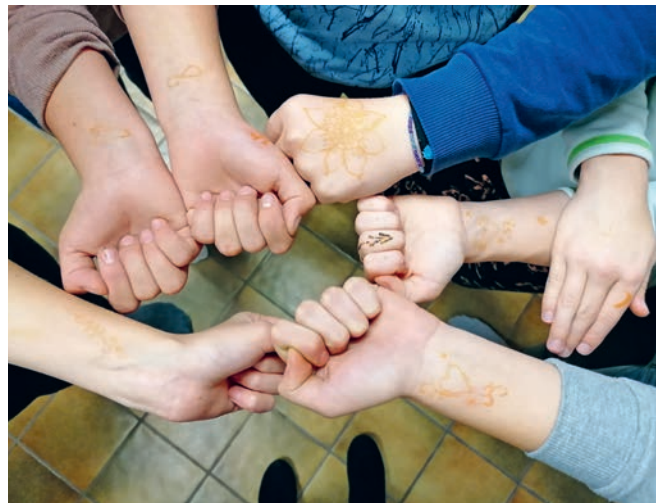
Die Mädchen präsentieren ihre Henna-Tattoos.

Wir möchten allen danken, die durch ihre Mithilfe und Unterstützung der Jugendarbeit Willisau-Gettnau ermöglicht haben ihre Tätigkeit so gut wie möglich aufrecht zu erhalten und sogar auszubauen. Ein besonderer Dank geht auch an die Gruppe von sieben 1. Oberstufen-Jungs, die tatkräftig beim Einrichten des neuen Jugendbüros mitgeholfen haben und massgeblich daran beteiligt sind, wie das neue Büro heute aussieht.