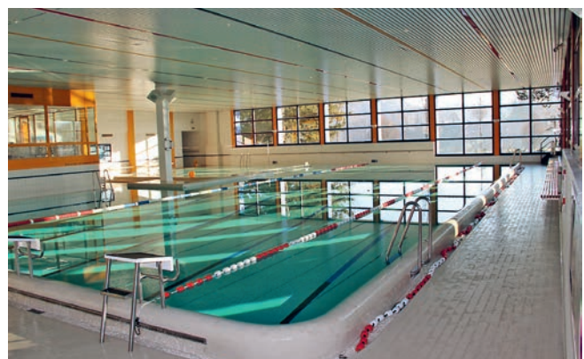
Erholung, Spiel, Spass und Sport: All das ist im Hallenbad möglich.