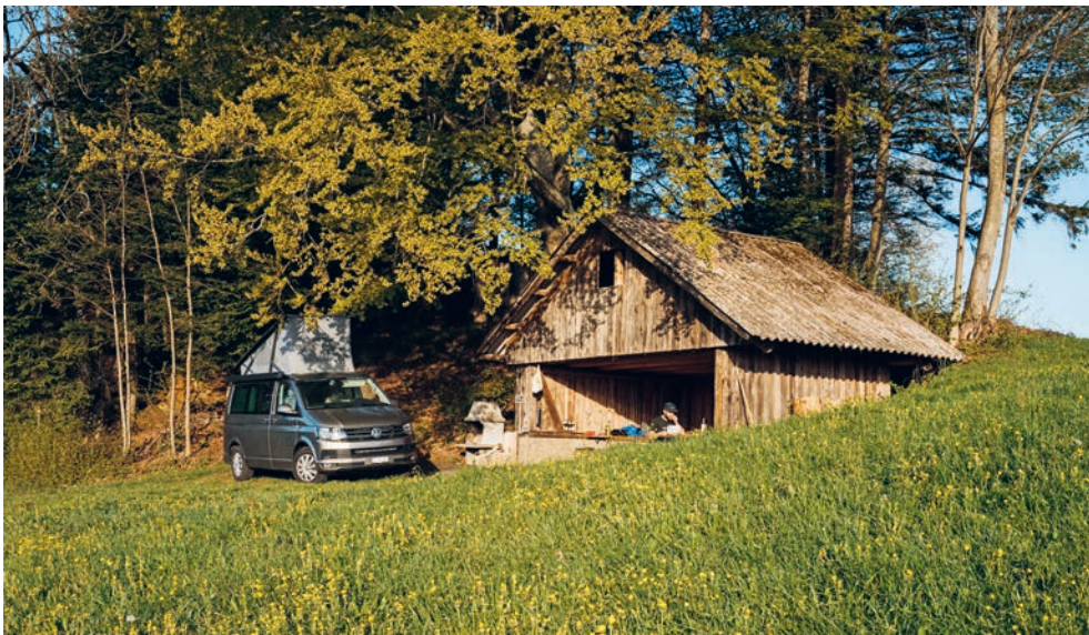
Tannen-Camp in der wunderschönen Napflandschaft in der Gemeinde Hergiswil bei Willisau.

Bei Interesse gibt Willisau Tourismus gerne Auskunft. info@willisau-tourismus.ch oder Telefon 041 970 26 66